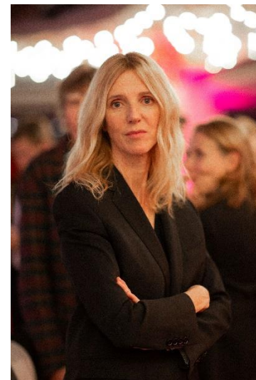
Sandrine Kiberlain