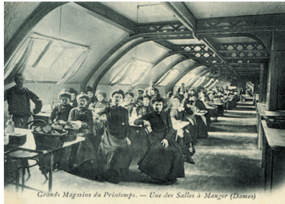
Grands Magasins du Printemps. — Une des Salles à Manger (Dames)